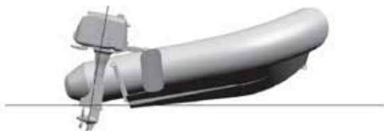
L'avant du bateau déjàuge, trop de trim positif