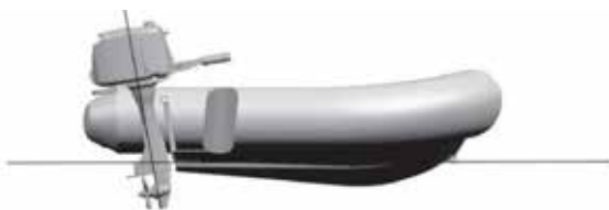
L'avant du bateau enfourne, trop de trim négatif

L'angle du moteur hors-bord peut être ajusté pour améliorer l'assiette et la performance générale. Effectuer des tests avec le moteur fixé à des angles différents pour trouver la position qui convient le mieux pour votre bateau et les conditions d'utilisations.